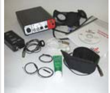
心理生理教学工具包

214 四通道数据记录器 LabScribe 数据记录分析软件 ECG/EMG/EEG 电缆 (HK/214 用) BNC-BNC 电缆 USB 电缆 12V 电源适配器 PT-100 脉搏换能器 EM-100 活动标记器 TM-100 温度传感器 GSR-200GSP(皮肤电反射)放大器 RM-200 呼吸测量带 BP-600 血压套件 可重复用脑电极 150 Ag/AgCl 电极 使用说明书