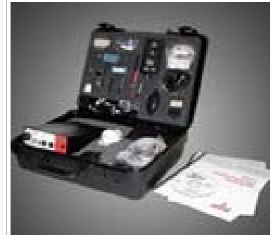
动物生理教学工具包

214 四通道数据记录器 LabScribe 数据记录分析软件 ECG/EMG/EEG 电缆 (HK/214 用) 刺激器电缆 BNC-BNC 电缆 USB 电缆 12V 电源适配器 NBC-300 神经浴槽 五针神经浴槽记录电缆 FT-104 张力换能器 DT-475 位移换能器 IC-200 细胞内探针 ISE-730 刺激电极 ISE-730 氧电极 PT-100 脉搏换能器 EM-100 活动标记器 FT-325 手提测力计 BP-700 血压套件 SP-300 肺活量计 TM-100 温度传感器 150 Ag/AgCl 电极 使用说明书