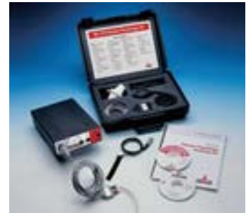
人体生理教学工具

HK-214S : Package 包装是 HK-214, IX-214 附上高电压刺激器 IX-214with High Voltage Stimulus Isolator.